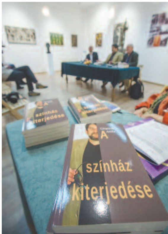
Fotó: Rab Zoltán

– Addig, ameddig van mit közölnöd vele. A néző is mérce. A mi művészetünk háromdimenziós, élő művészet: amelyik pillanatban befejezed, abban a pillanatban véget ér. Lehet dokumentálni, lehet rögzíteni, de akkor is vége van – hallottuk a Pont Kiadó könyvbemutatóján.