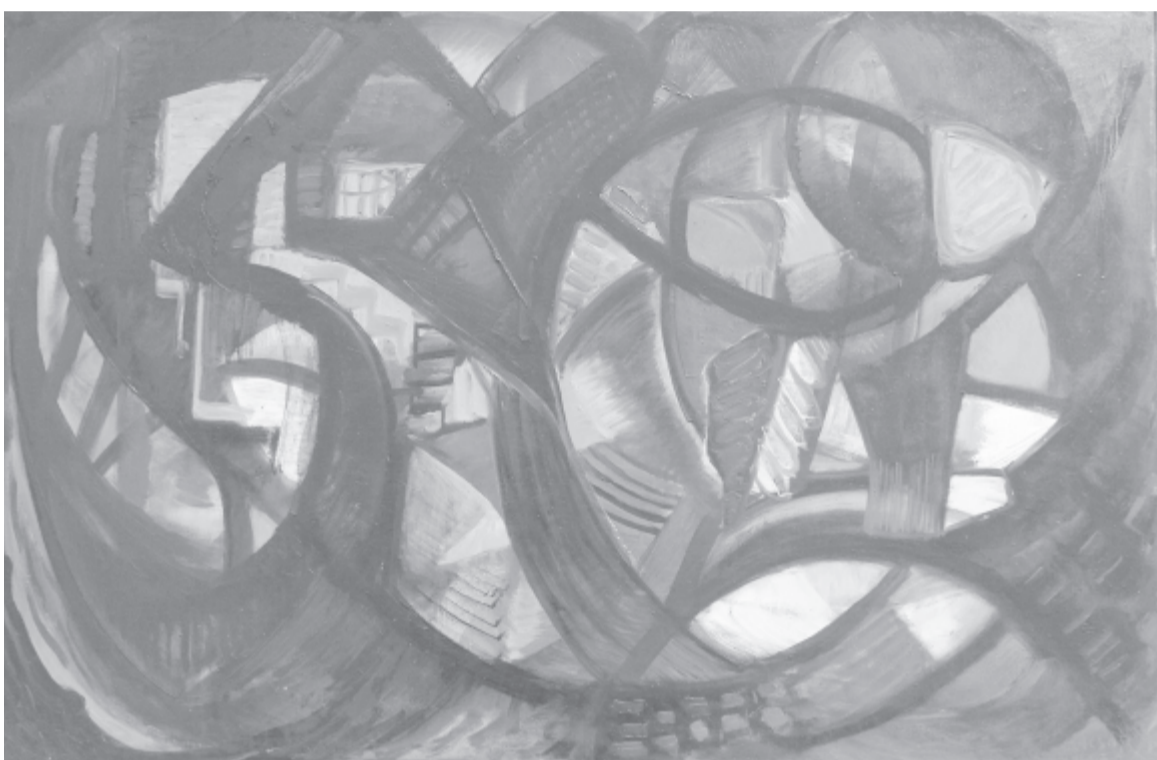
Mellékletünket Kulcsár Béla alkotásaival illusztráltuk. A művész emlékkiállítás a Bernády Házban látható