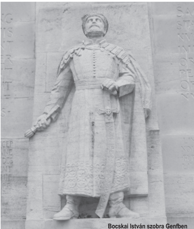
Bocskai István szobra Genfben

„A most Dózsa Lászlót támadó történészek miért nem szólaltak meg akkor, amikor elmesélte történetét 2007-es önéletrajzi kötetében?” – tette fel a kérdést Békés Márton. „Én nem vonom kétségbe, hogy Pruck Pál részt vett az '56-os utcai eseményekben, de pontos szerepe nem tisztázott. Ezért is lenne fontos, hogy a lánya elfogadja a Terror Háza Múzeum főigazgatójának meghívását, és személyesen beszélhessük meg vele, hogy miképpen dolgozunk együtt tovább '56 hőseinek megbecsüléséért” – fűzte hozzá a történész.